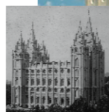
Malumalu o Sate Leki