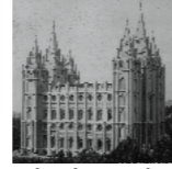
Salt Lake Temple