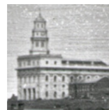
พระวิหารนอู