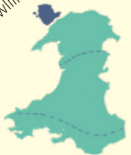
Juon bukōn ilo Wales ekar jikin eo āt eo etan aitook tata ilo laj in.

Lan faw gwyn gylligogenych wy m dro b williant y siliogogoch