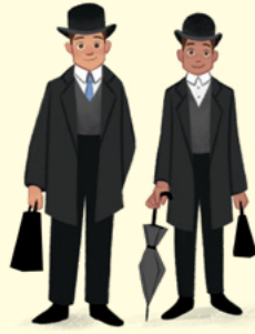
Mijenede ro moktata raar itok nān Wales ilo 1840 eo.

Margaret ekar juon ioon teek eo im lale ʎok maʎo eo ebūʎu lipeʎaakin. Wa eo ekajkaj ioon ʎo ko reʎʎap.