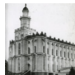
Храм в Сент-Джордже, штат Юта, США