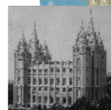
Храм в Солт-Лейк-Сити