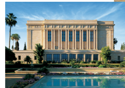
Храм в Месе, штат Аризона, США

1997 год: Президент Гордон Б. Хинкли объявил о проекте строительства небольших храмов. В 1998 году он объявил о своем намерении к 2000 году довести общее число действующих храмов до ста.