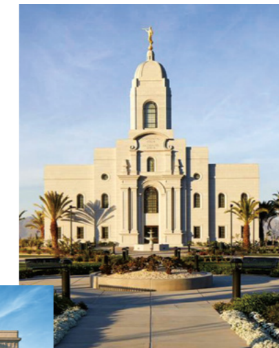
Храм в Арекипе, Перу

2000 год: Президент Хинкли посвятил четыре храма за одну неделю (с 11 по 18 июня): храм в Фукуока, Япония, храм в Аделаиде, Австралия, храм в Мельбурне, Австралия, и храм в Суве, Фиджи.