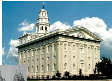
Храм в Наву, штат Иллинойс (восстановленный)

1945 год: в храме в Месе, штат Аризона, США, стали проводить таинства на испанском языке. Это первый храм, в котором таинства совершались не на английском языке.