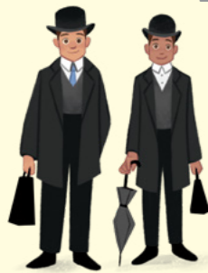
A lako mai na imatai ni daukaulotu ki Welesi ena 1840.