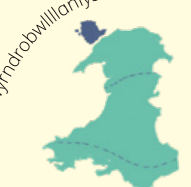
E dua na koro mai Welesi e tiko kina na yaca ni tauni balavu dua e vuravura.

Lanfoni gwen gylligogenychwyrddrobwilliantysiliogogoch