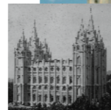
Salt Lake tempel