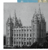
Tempio di Salt Lake