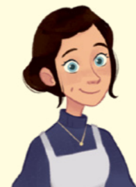
Alihudumu kama rais wa Muungano wa Usaidizi kwa miaka 26.