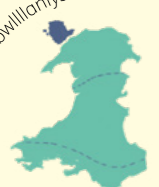
Kijiji cha Wales kina mji wenye jina refu zaidi ulimwenguni.

Lanforpawnygyligogenychwmyndrobwilliantysiliogogoch