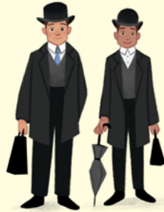
Wamisionari wa kwanza walikuja Wales mnamo 1840.