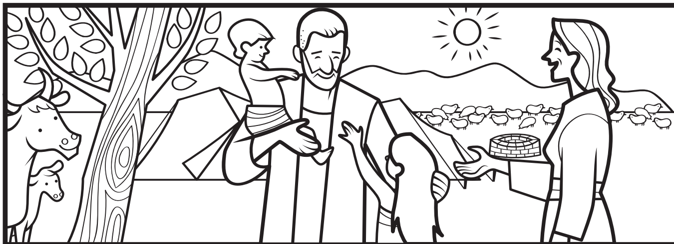
Иов 1-3, 42