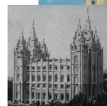
A Salt Lake templom