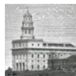
A Nauvoo templom