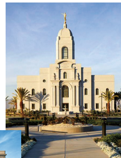
A Perui Arequipa templom

1945: Az Arizonai Mesa templom spanyolul is nyújtott szertartásokat. Ez volt az első templom, ahol a szertartásokat az angolon kívül más nyelven is bemutatták.