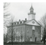
A Kirtland templom

1847: Brigham Young csupán négy nappal a völgybe érkezése után bejelentette a leendő Salt Lake templomot. A templom felszentelése egészen 1893-ig várattott magára.