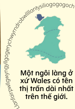
Một ngôi làng ở xứ Wales có tên thị trấn dài nhất trên thế giới.