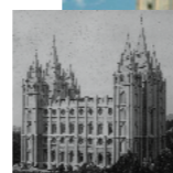
Templo de Salt Lake