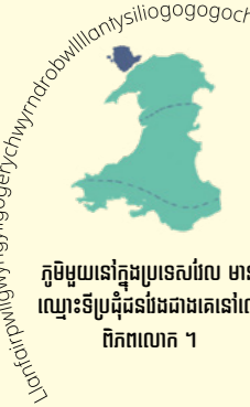
ភូមិមួយនៅក្នុងប្រទេសប៊ែល មាន ឈ្មោះទីប្រជុំជនបែងជាងគេនៅលើ ពិភពលោក ។