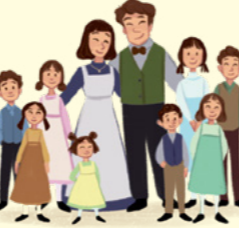
នៅពេលម៉ាហ្គាវ៉ែតបានធំឡើង នាងបានរៀបការ ហើយមានកូន ប្រាំបីនាក់ ។