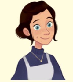
នាងបានបម្រើជាប្រធានសមាគមសង្គ្រោះ អស់រយៈពេល ២៦ ឆ្នាំ ។