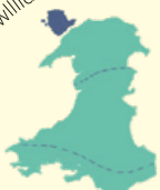
Þorp í Wales hefur lengsta bæjar-nafn í heimi.

Lanforþingvinnugyligogenychwmyndróbwillantysiliogogoch