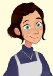
Hún þjónaði sem Líknarfélagssforseti í 26 ár.