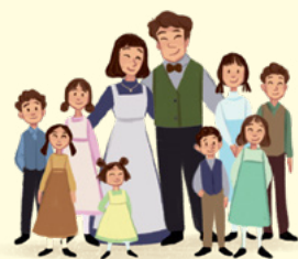
Ko je odrasla, se je poročila in imela osem otrok.