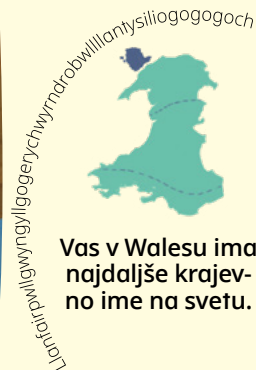
Vas v Walesu ima najdaljše krajevno ime na svetu.