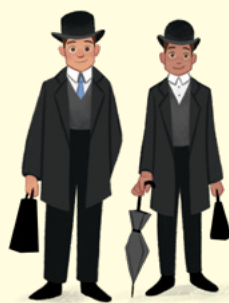
Prvi misijonarji so v Wales prišli leta 1840.