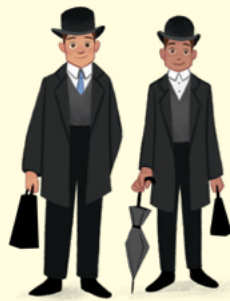
Primii misionari au venit în Țara Galilor în anul 1840.