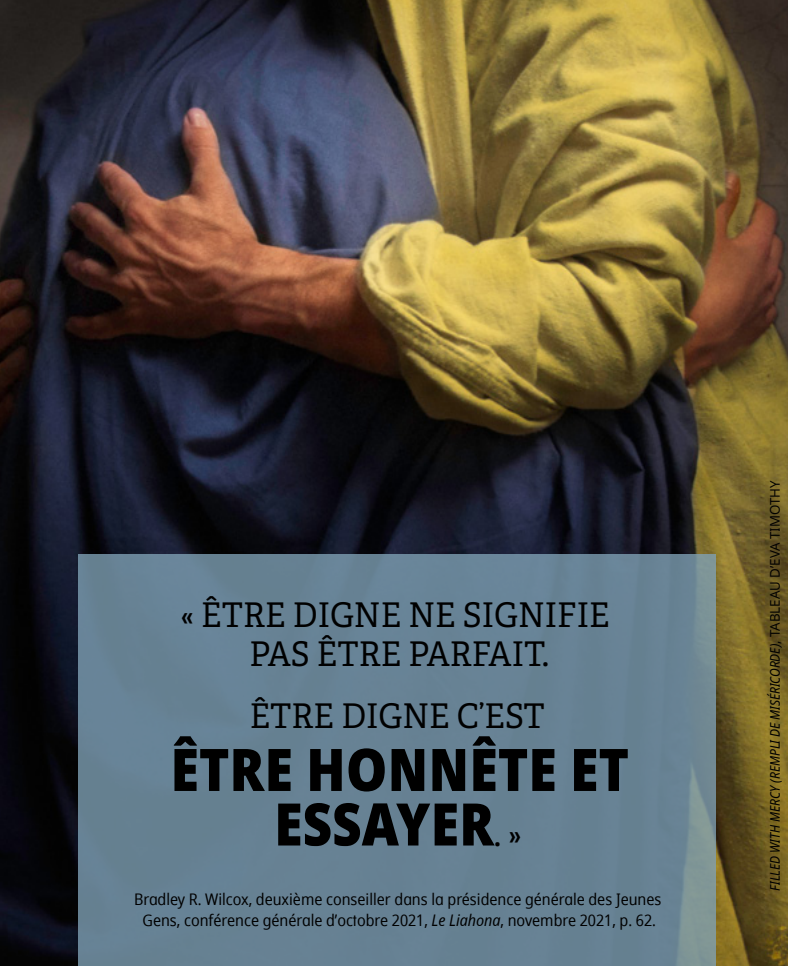
FILLED WITH MERCY (REMPLI DE MISÉRICORDIE), TABLEAU D'EVA TIMOTHY

« ÊTRE DIGNE NE SIGNIFIE PAS ÊTRE PARFAIT.