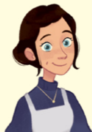
Ji 26 metus tarnavo Paramos bendrijos prezidentė.