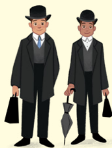
Pirmieji misionieriai į Velsą atvyko 1840 m.