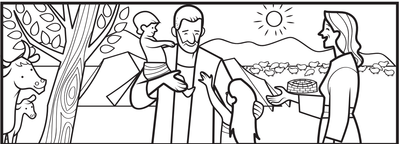
Ayub 1-3, 42