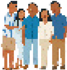
Elder Villanueva ma lana ava, o Leticia, e toatolu o la alo.