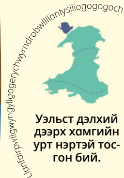
Уэльст дэлхий дээрх хамгийн урт нэртэй тосгон бий.