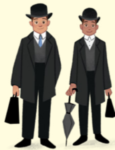
Esimesed misjonärid saabusid Walesi aastal 1840.

Margaret seisis laevatekil ja vaatas ennast ümbritsevat sinist ookeani. Laev kiikus hiiglaslikel lainetel üles ja alla.