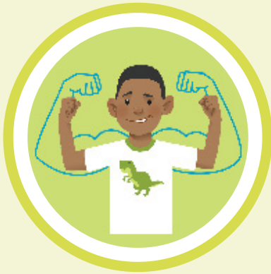
a. Siya molig-on ug motabang kanato.

Si Isaias nanagna kabahin ni Jesukristo. Kana nagpasabot nga siya nagtudlo kabahin ni Jesukristo sa wala pa natawo si Jesus. Basaha kini nga mga kasulatan ug ipares ang mga bersikulo ngadto sa unsa ang gitudlo ni Isaias kabahin ni Jesus.