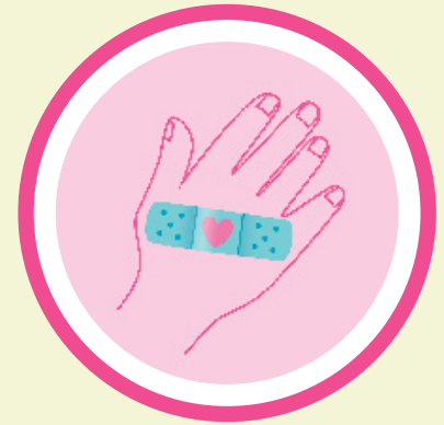
c. Siya moayo kanato.