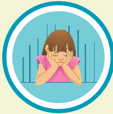
b. Siya mopahid sa atong mga luha.