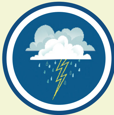
e. Siya ang usa ka dangpanan gikan sa mga unos.