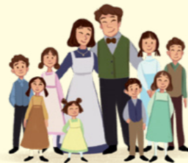
Když vyrostla, provdala se a přivedla na svět osm dětí.