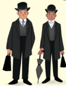
První misionáři přišli do Walesu v roce 1840.