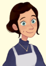
Celých 26 let sloužila jako presidentka Pomocného sdružení.