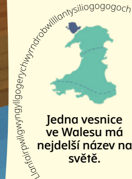
Jedna vesnice ve Walesu má nejdelsí název na světě.