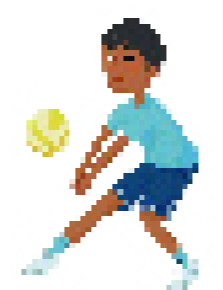
เมื่อเขายังเด็ก มอยเซสชอบเล่น วอลเลย์บอล

คุณแม่ใส่เงินเปโซลงในซองแล้วปิดผนึก “นี่เป็นเงินศักดิ์สิทธิ์” เธอก้าว “เราต้องจ่ายส่วนสิบของเรา”