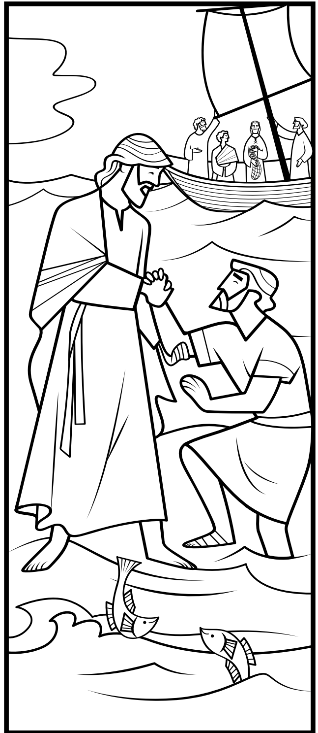
ម៉ាថាយ ១៤ ( ម៉ាកុស ៦, យ៉ូហាន ៦ )

🔍 តើព្រះយេស៊ូវ បានសួរអ្វីដល់ពេត្រុស បន្ទាប់ពីទ្រង់បានសង្គ្រោះគាត់ ?