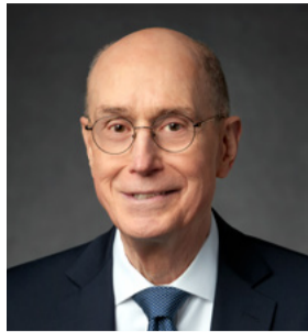
Henry B. Eyring Deuxième conseiller