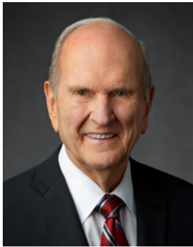
Russell M. Nelson Président