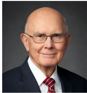
Dallin H. Oaks Premier conseiller