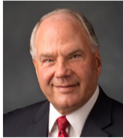
Ronald A. Rasband