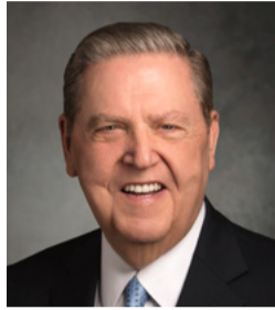
Jeffrey R. Holland