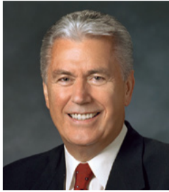
Dieter F. Uchtdorf