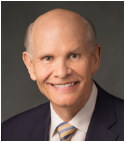
Dale G. Renlund