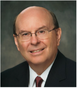
Quentin L. Cook