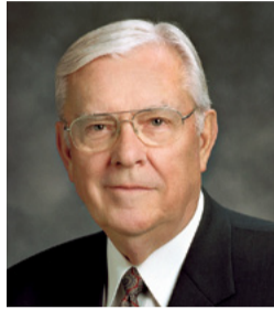
M. Russell Ballard