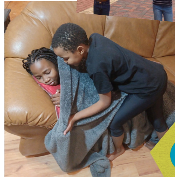
ภาพประกอบโดย ลิซา ฮันท์

เซบิไซล์ติดตามพระเยซูโดยนึกถึงคนอื่นและสิ่งที่พวกเขาต้องการ เปิดหน้าต่างไปเพื่ออ่านเรื่องราวเกี่ยวกับวิธีที่พระเยซูทรงนึกถึงผู้อื่น