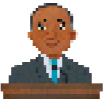
今天，摩伊希斯·威拉纽瓦长老担任总会持有权柄七十员。