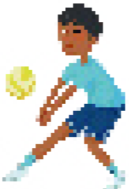
摩伊希斯小时候喜欢打排球。

摩伊希斯想起传教士教导的，有关什一奉献的事。他们说，要把收入的百分之10交给神，协助祂的事工。