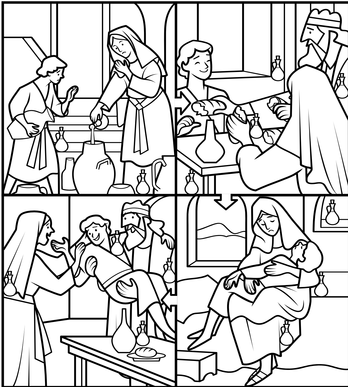
1. kuninkaiden kirja 17