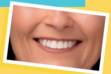
사진 속 미소만 보고도 누구인지 맞힐 수 있는가? 이 자매는 교회의 여러 본부 회장단 가운데 한 곳에 속해 있다.