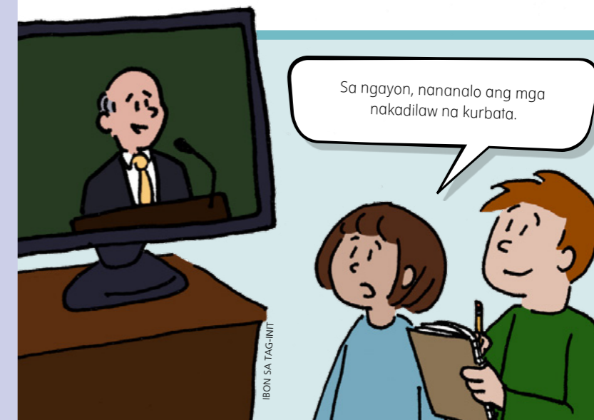
IBON SA TAG-INIT