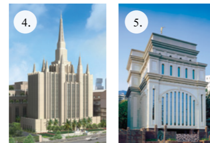
ภาพประกอบโดย โจเซฟ ทาเกต