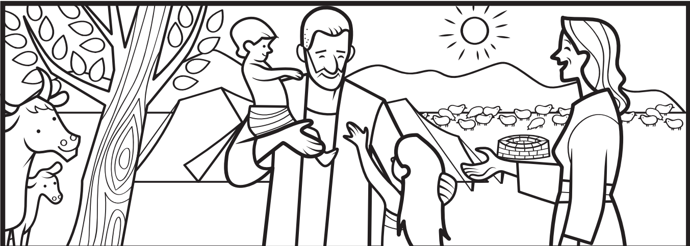
Job 1-3, 42