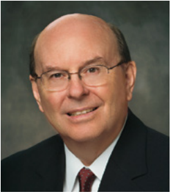
Quentin L. Cook