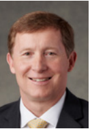
L. Todd Budge Rikakpilōklōk eo Kein Karuo