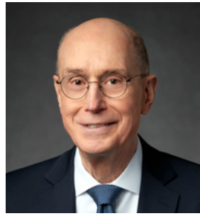
Henry B. Eyring Rikakpilōklōk eo Kein Karuo