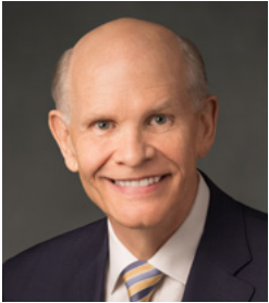
Dale G. Renlund