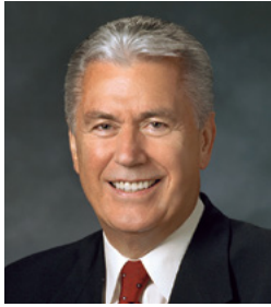
Dieter F. Uchtdorf