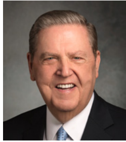
Jeffrey R. Holland