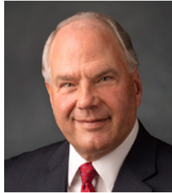
Ronald A. Rasband