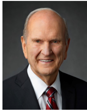
Russell M. Nelson Būreejtōn