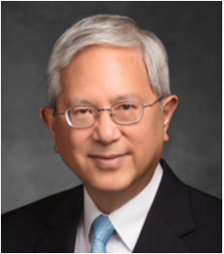
Gerrit W. Gong