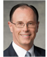
W. Christopher Waddell Rikakpilōklōk eo Kein Kajuon