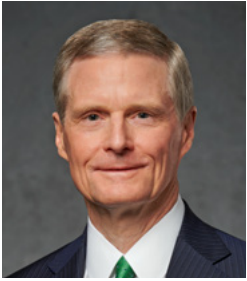
David A. Bednar