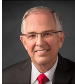
Neil L. Andersen