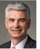
Gérald Caussé Bisop eo Utiej ej Tōl