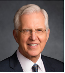
D. Todd Christofferson