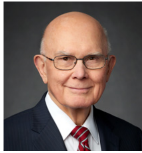
Dallin H. Oaks Rikakpilōklōk eo Kein Kajuon