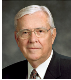
M. Russell Ballard