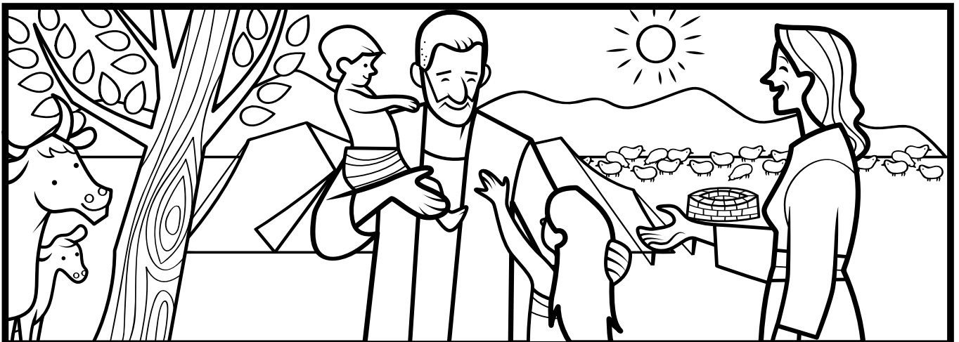
욘기 1~3장, 42장