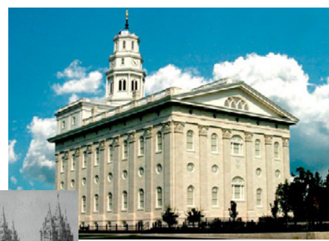
일리노이 나부 성전(재건됨)