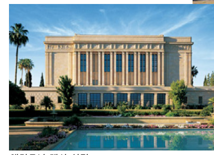
애리조나 메사 성전