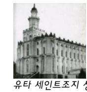
유타 세인트조지 성전