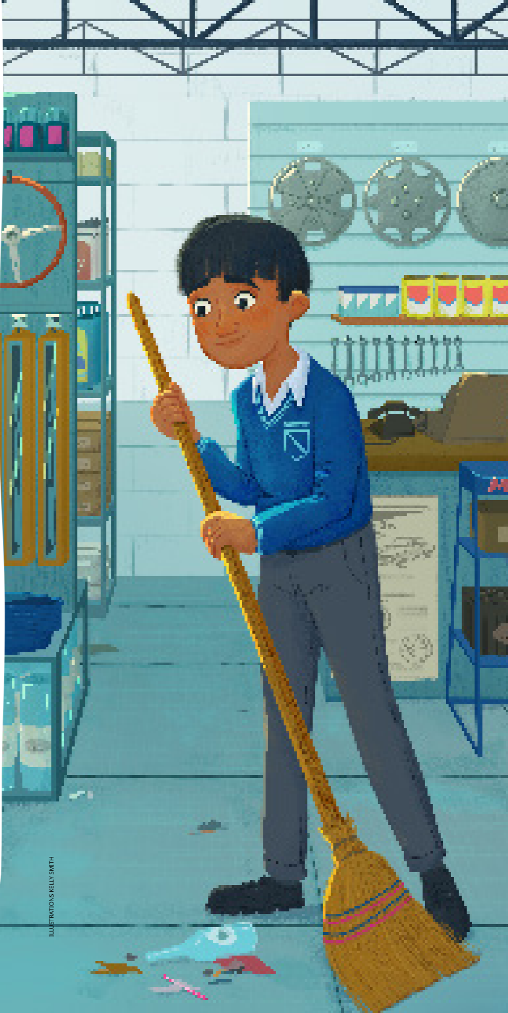
ILLUSTRATIONS KELLY SMITH

Aujourd'hui, Moisés Villanueva est soixante-dix Autorité générale.