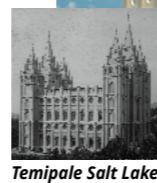
Temipale Salt Lake