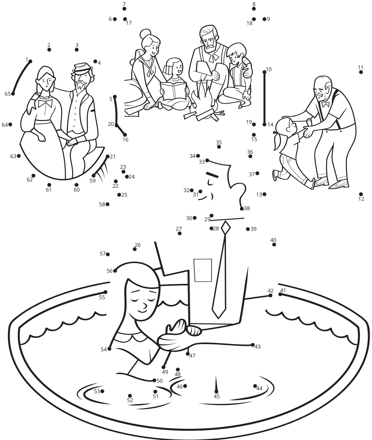
Tokāteline mo e Ngaahi Fuakava 128

Na'e 'ai 'e Sīsū Kalaisi ke tau malava 'o fakahoko 'a e ngaahi ouau ma'á e kau pekiá ke lava 'etau ngaahi kui kuo pekia ka ne te'eki ke nau 'ilo ki he ongoongolelei, 'o toe foki hake 'o nofo fakataha mo e Tamai Hēvani. Fakafehokotaki e ngaahi fo'i totí ke fakahaa'i 'oku hanga 'e he ngaahi ouau 'o e papitaiso ma'á e kau pekiá 'o fakafehokotaki fakataha e ngaahi fāmilí.