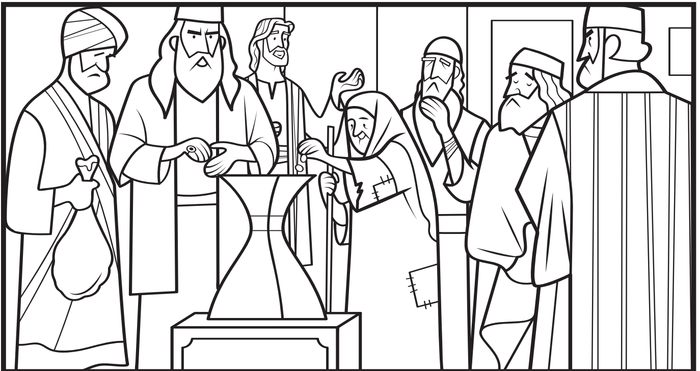
Marcos 12 (Lucas 21)