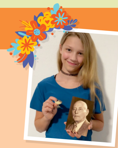
MGA PAGHULAGWAY PINAAGI NI DAVID KLUG

1920, nga sa katapusan naputlan sa iyang bukton. Ikaw makasugod pinaagi sa pagpakig-istorya sa imong mga ginikanan o mga apohan kabahin sa mga istorya nga ilang nahinumdoman, o mahimo ka nga maghimo og family history account diha sa FamilySearch.org . Kon kamo nakahibalo og bisan unsa nga makalingaw nga mga istorya kabahin sa inyong mga katigulangan sa pagdagan sa panahon, pahibalo kami sa fts@ChurchofJesusChrist.org .