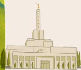
'I he 'aho ní, 'oku 'i ai ha temipale 'i Metuliti, ko e kolomu'a ia 'o Sipeiní.