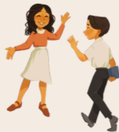
Na'á ne tokoni 'i he Palaimelí 'aki 'ene hoko ko ha tokotaha talitali kakai lelei mo talitali lelei 'a e fānaú 'i he 'enau 'u atú.