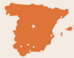
Ko Sipeiní ko ha fonua lea faka-Sipeini ia 'i he fakahiifo 'o 'Iulopé.

Fai 'e Lucy Stevenson Ewell 'Ū Makasini 'a e Siasí (Makatu'unga 'i ha talanoa mo'oni)